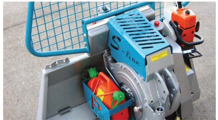
Halter für Kraftstoffkombikanister und Motorsäge

Der Waldbauer, sowie der anspruchsvolle Privatwaldbesitzer hat den Anspruch, eine professionelle Getriebeseilwinde einzusetzen, die ruhig läuft, kraftvoll zieht und zuverlässig bremst. Die neu entwickelte Panzelt Dreipunktseilwinde 91 S-line erfüllt diese Anforderungen. Sie lässt bei der Bedienung und Arbeitsweise - Dank des Schneckengetriebes im Ölbad , der Sinterlammellenkupplung und -bremse, sowie der serienmäßigen Funksteuerung - keine Wünsche offen.